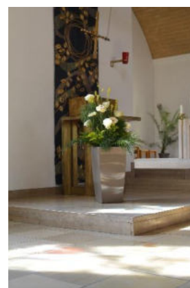
St. Alto, Unterhaching