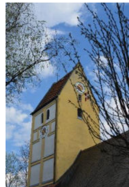
St. Korbinian, Unterhaching

Wir werden versuchen, die Hilfe zu organisieren!