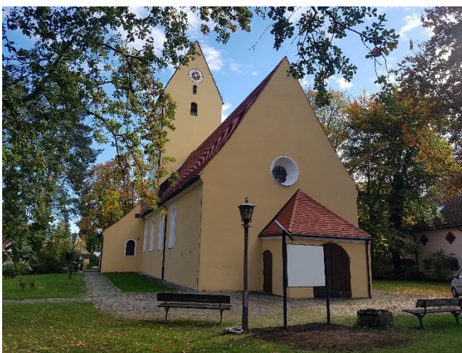
Pfarrkirche St. Korbinian nach Abschluss des ersten Renovierungsabschnittes im Herbst 2022

Vom Kirchturm leuchtet weithin ein frisch vergoldetes Kreuz. Die Ziffernblätter und die Zeiger der Kirchturmuhre wurden restauriert und das Uhrwerk und das Schlagwerk wieder in Gang gesetzt. Die Maler verliehen der Pfarrkirche durch den neuen Anstrich der Außenfassade ein besonders festliches Aussehen.